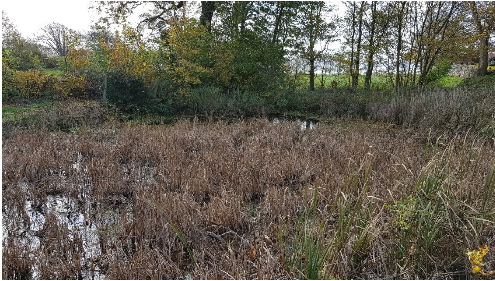
Figur 3. Foto fra besigtigelsen.